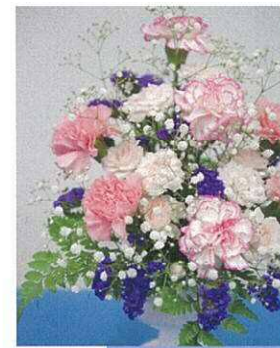
アレンジ用生花 3,300円～

供養のためのお花のことなら 何でもお気軽にご相談下さい。 そのままお持ち帰りいただける籠入りの生花や 墓所用のお花など、さまざまなご要望に お応えいたします。