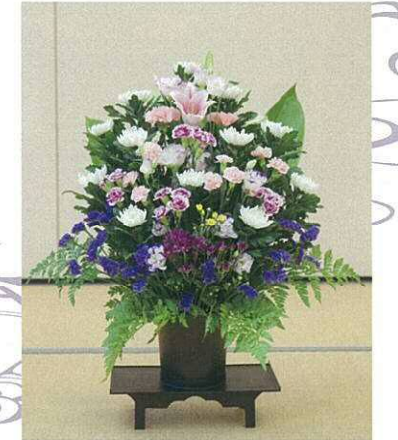
お供えアレンジ生花 1基 8,800円 1対 17,600円